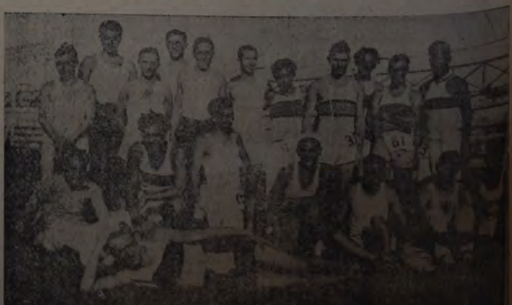
OTRO CONJUNTO DE ATLETAS QUE INTERVINIERON EN EL CERTAMEN ATLETICO DE AYER. 1o. River Plate, Sportivo Barracas.