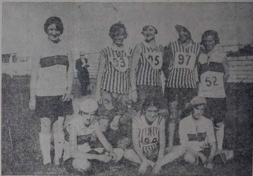
COMO DEJAMOS CONSIGNADO EN LA CRONICA, EL TORNEO INTER CLUBS DE AYER VIOSE FAVO. recido con la participación femenina. La presente nota gráfica muestra una parte de las competidoras.