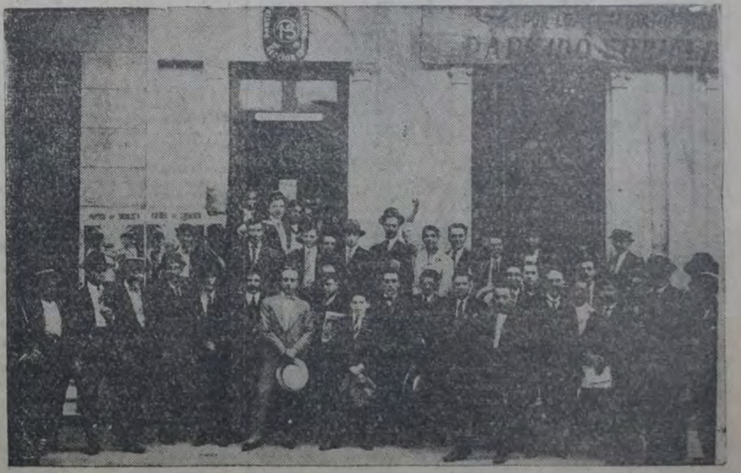
ANTE EL LOCAL DEL CENTRO DE LA 19a.