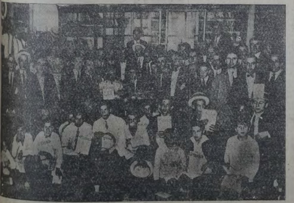
EN EL CENTRO DE LA SECCION 18a.

El subcomité "Castellani" Un grupo de simpatizantes abrió en