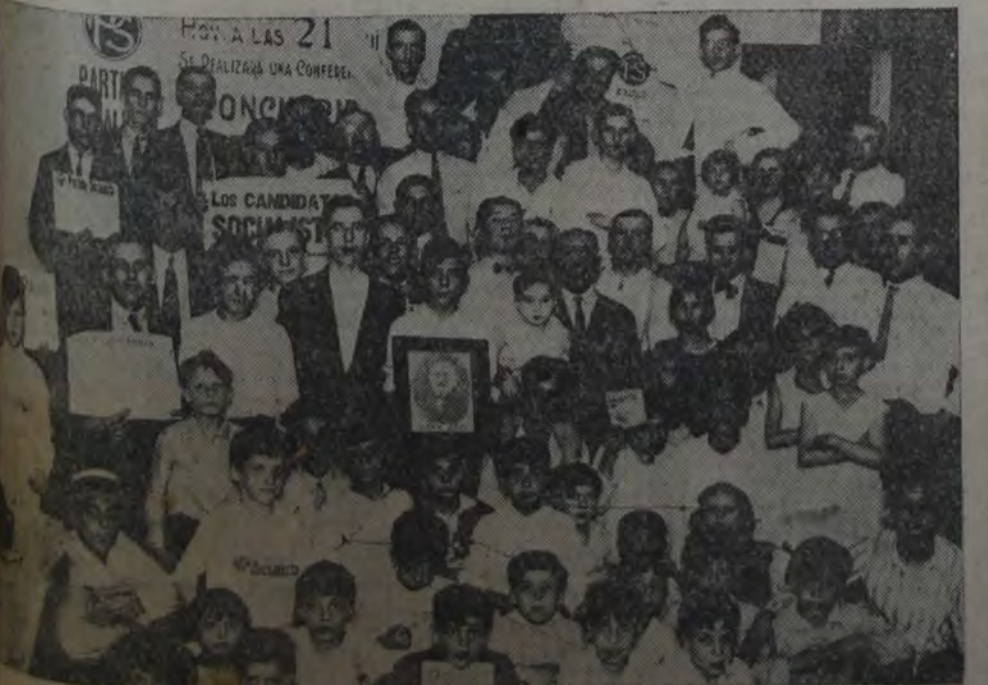
ASPECTO DEL LOCAL DE LA 17a.