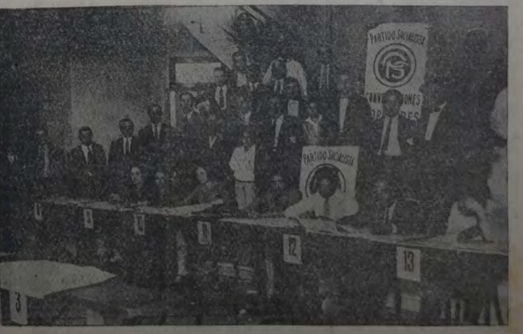
EN LA CASA DEL PUEBLO